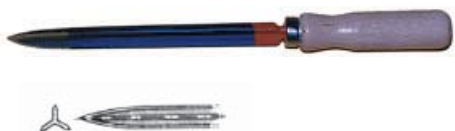
RASQUETA TRIANGULAR ACANALADA