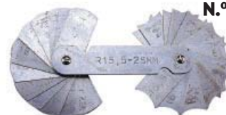
JGO. GALGAS RADIOS