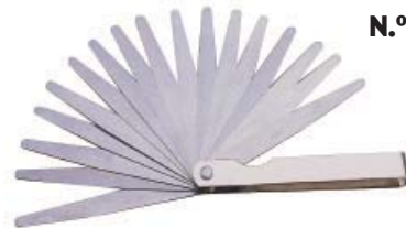
JGO. GALGAS ESPESOR 100 MM. LARGO