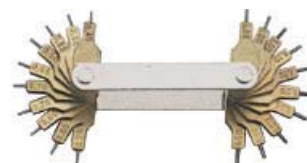
JGO. GALGAS AGUJEROS