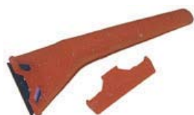
RASQUETA DE PLASTICO